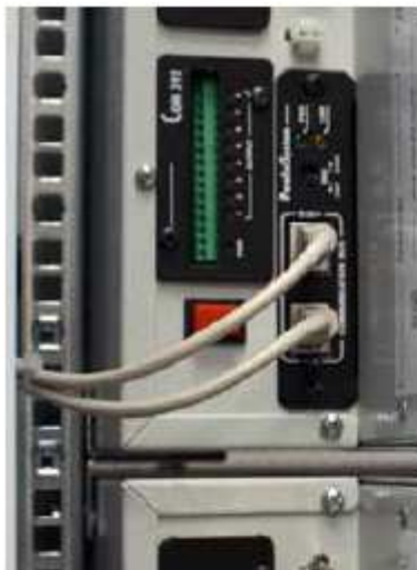
Parallèle et carte de contacts relais programmables